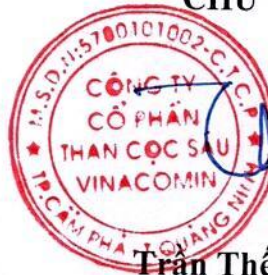
Trần Thế Thành